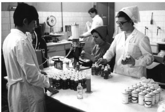
MARVIN, LABORATORIO 1967